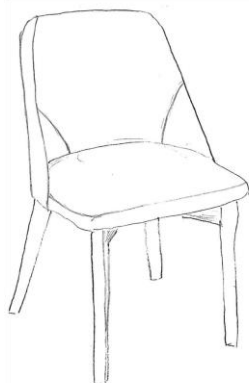
Rys. 1 KRZESŁO (dot. poz. 8)